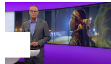
Het journaal L - 25/08/15