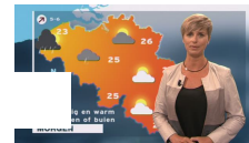
Het weer 20u